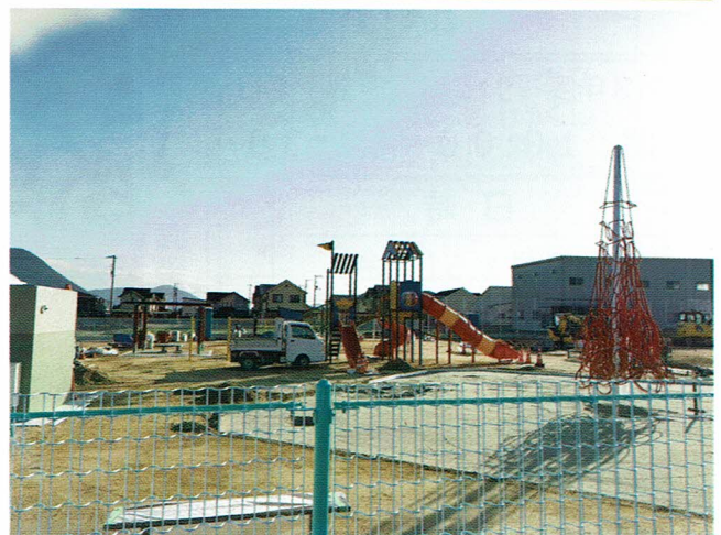
令和8年3月現在。着々と工事が進んでいます。