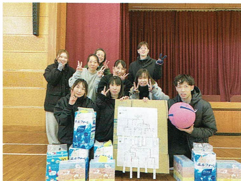
2トーナメントで試合が行われ、それぞれ『チーム：かつちゃん』と『チーム：かわちゃん』が優勝しました！！